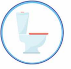
зменшення кількості сечі